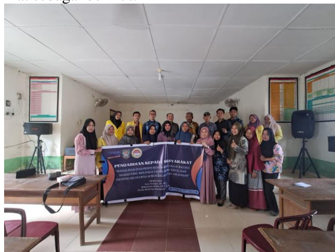
Gambar 5. Foto Bersama Dengan Tim Pengabdian Dan Para Pelaku Usaha

Selanjutnya pemateri melakukan evaluasi, dengan meminta mitra mengisi angket post test , hal ini dilakukan untuk melihat kesungguhan mitra terhadap kegiatan yang sedang dilakukan, kemudian menjawab pertanyaan mengulang kembali materi yang belum dipahami sesuai dengan permintaan para mitra atau peserta. Kemudian dilanjutkan dengan berfoto bersama di akhir sesi kegiatan pengabdian kepada masyarakat seperti terlihat sebagai berikut: