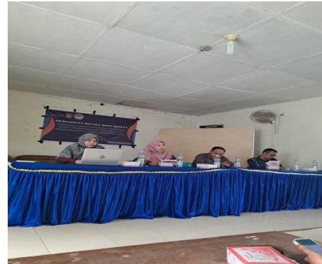
Gambar 4. Sesi Tanya Jawab Setelah Penyampain Materi

Pada tahap ini, peserta sangat antusias untuk bertanya dan bercerita masalah yang sedang dihadapi terkait dengan pemasaran UMKM yang ada di desa Subur Kecamatan Air Joman, Mayoritas warga Desa Subur adalah pelaku usaha seperti penjual makanan dan minuman. Salah satu peserta pengabdian yang merupakan pelaku usaha kerupuk menanyakan bagaimana cara mengembangkan pemasaran agar usahanya bisa maju dan penjualan lebih meningkat. Pemateri memberikan solusi kepada para pelaku usaha tersebut untuk melakukan promosi/iklan melalui sosial media seperti facebook, instagram, atau toko-toko online. Pemateri juga memberitahu bahwa perlunya membuat nama merek untuk produk dan meningkatkan kemasan produk mereka agar lebih dikenal dan menarik konsumen.