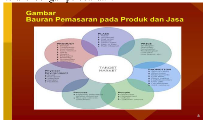
Gambar 2. Slide Materi Bauran Pemasaran Pada Produk Dan Jasa

People adalah seseorang yang berperan dalam memberikan atau menyajikan layanan kepada konsumen selama proses pembelian barang. Process adalah mencakup bagaimana cara perusahaan memenuhi permintaan dari setiap konsumennya. Physical Evidence atau bukti fisik merujuk pada semua aspek yang dapat dilihat langsung oleh pelanggan saat berinteraksi dengan perusahaan.