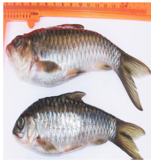
Gambar 1. Sampel Ikan Jurung ( Tor sp ) yang Diamati

Berdasarkan pengamatan morfologi, ikan jurung memperlihatkan beberapa karakteristik mendasar sebagaimana ikan lainnya.