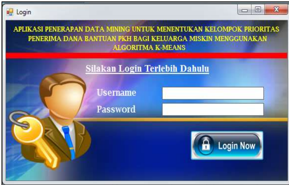
Gambar 4. Tampilan Form Login

Kecamatan Medan Tembung menggunakan algoritma K-Means. Hal ini bertujuan untuk mengaktifkan atau membuka layanan halaman K-Means dengan terlebih dahulu mengisi username dan password yang telah terdaftar di database. Formulir login muncul dalam format berikut: