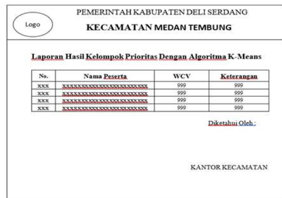
Gambar 3. Laporan

Perancangan ini merupakan perancangan untuk menampilkan data hasil perhitungan menggunakan algoritma k-means. Tampilan laporan hasil kelompok prioritas adalah sebagai berikut: