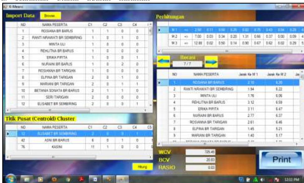
Gambar 5. Tampilan Form K-Means

pertama dari program sistem, yang dapat diakses oleh petugas setelah menyelesaikan proses login. Berikut ini adalah representasi dari bentuk k-means: