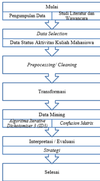
Gambar 1 Kerangka Penelitian

Menurut Larose, data mining merupakan analisis dari peninjauan kumpulan data untuk menemukan hubungan yang tidak diduga dan meringkas data dengan cara yang berbeda dengan cara yang sebelumnya yang dapat dipahami dan bermanfaat bagi pemilik data [10]. Proses Knowledge Discovery Database (KDD) secara garis besar dapat dijelaskan yaitu sebagai berikut : 1. Pembersihan Data ( Cleaning Data ), 2. Transformasi ( Transformation ), 3. Data mining , 4. Interpretasi/ evaluasi ( interpretation/ evaluation ) [11]. Kerangka penelitian ini dapat dilihat pada gambar 1.