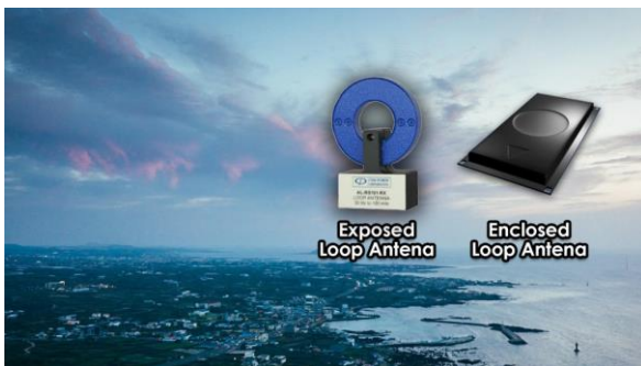
Gambar 4. Tampilan Komponen Antena