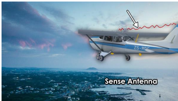
Gambar 3. Tampilan Sense Antenna