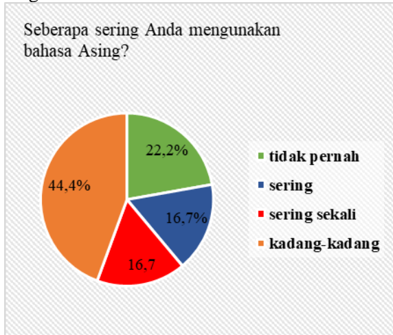
Tabel Diagram 2

penelitian percakapan melalui ruang pesan grup komunitas Kampung Dongeng Sumatera Utara menggunakan bahasa Indonesia. Selanjutnya kita akan mengetahui apakah para responden sering menggunakan bahasa asing dalam keseharian responden kita lihat dari tabel diagram berikut :