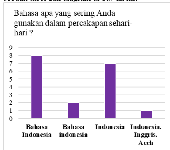
Tabel Diagram 1. Hasil Penggunaan Bahasa Percakapan Sehari-Hari

Pembahasan hasil penelitian dari kuesioner tersebut dapat dijelaskan dalam sebuah tabel dan diagram di bawah ini: