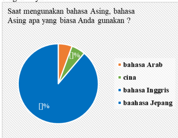
Tabel Diagram 3.

Hasil Rata-Rata Penggunaan Bahasa Asing Diagram di atas menunjukkan 44,4% relawan kampung dongeng sebagai responden pada kuesioner ini hanya kadang-kadang menggunakan bahasa asing. Kemudian saat menggunakan bahasa asing bahasa apa saja yang digunakan responden pada penelitian ini, berikut tabel diagramnya :