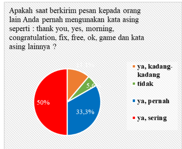
Tabel Diagram 4.

Aktivitas Penggunaan Bahasa Asing Sehari-hari