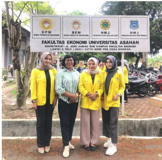
Gambar 2. Narasumber beserta Mahasiswa Kegiatan PKM