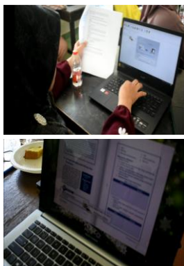
Gambar 3. Pendampingan Membuat LKPD dengan Aplikasi Kvisoft Flipbook