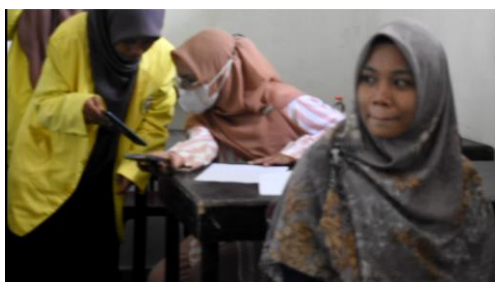
Gambar 4. Pendampingan Pembuatan Website di Sekolah

Kegiatan pendampingan ini juga bermaksud saling kolaborasi tim dan mitra untuk penyempurnaan sistem website yang telah dibuat oleh para tim PKM sehingga bisa dimanfaatkan semua pihak di sekolah mitra. Sehingga pihak sekolah memiliki hyperlink web yang bisa digunakan oleh sekolah baik siswa, guru dan tenaga kependidikan.