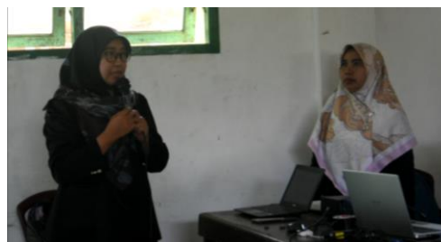
Gambar 2. Pelatihan Pembuaan Konten WEB

bahan ajar berupa LKPD yang sesuai dengan literasi digital, pentingnya media pembelajaran disandingkan dengan LKPD, manfaat media pembelajaran kvisoft flipbook maker, membuat LKPD dengan aplikasi kvisoft flipbook maker.