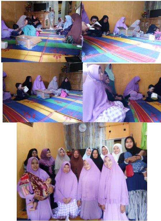
Gambar 3. Dokumentasi kegiatan

yang bisa digunakan untuk mendata keanggotaan dan manajemen keuangan secara transparan dan juga keluar masuk uang yang ada dan dilanjutkan dengan praktek langsung penggunaan dari contoh aplikasi yang akan dibangun nantinya dengan menggunakan smartphone masing masing seperti gambar 3. Dalam penyampaian materi team menggunakan printout untuk semua anggota yang sudah disiapkan serta slide ms. Power Point untuk membantu agar para anggota dan pengurus perwiraan lebih mengerti apa yang akan disampaikan serta tanya jawab antar team dengan para anggota perwiraan. Di akhir pelaksanaan team dan para peserta melakukan foto bersama untuk dijadikan dokumentasi pelaksanaan kegiatan.