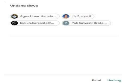
Gambar 6. Menu undangan bergabung dalam Class Room