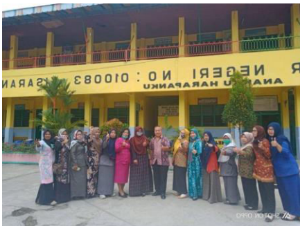
Gambar 4. Foto Bersama Selesai Pelaksanaan Pelatihan

Setelah pelaksanaan praktikum, acara selanjutnya adalah foto bersama telah selesai melaksanakan pelatihan dengan lancar walaupun hanya sebagian peserta maupun sebagian tim pengabdian karena situasi dan kondisi masing-masing dapat dilihat pada gambar 4 berikut ini: