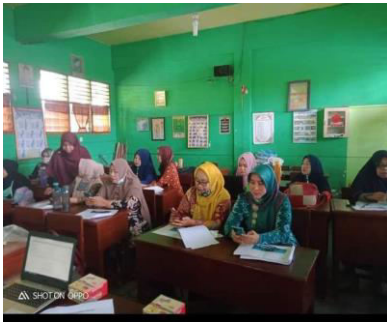
Gambar 3. Pelaksanaan Pelatihan

Setelah pelaksanaan praktikum, acara selanjutnya adalah foto bersama telah selesai melaksanakan pelatihan dengan lancar walaupun hanya sebagian peserta maupun sebagian tim pengabdian karena situasi dan kondisi masing-masing dapat dilihat pada gambar 4 berikut ini: