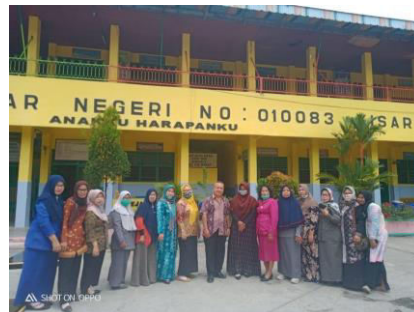
Gambar 1. Sebagian Peserta Pelatihan

Dewi Astuti, M.Pd dan Sri Rafiqoh, S.Si., M.Pd., dan dibantu oleh beberapa mahasiswa. Adapun sebagian peserta pelatihan ini dapat dilihat pada gambar 1 berikut ini :