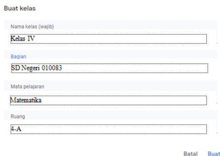
Gambar 5. Membuat Kelas Belajar

Berikut ini adalah fitur-fitur yang dibuat selama pelaksanaan praktikum Google Class Room yang dapat dilihat pada gambar 5, gambar 6, dan gambar 7 berikut ini :