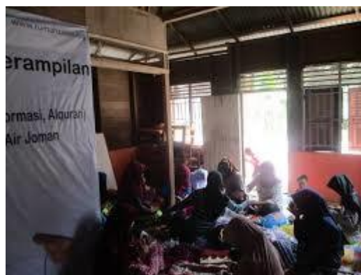
Gambar 1 Praktek Pembuatan Tas

Analisis Kebutuhan Dari hasil survei lapangan dan wawancara terhadap pengelola pengerajinan TAS, selanjutnya dibuat rancangan awal website e-commerce yang meliputi fitur-fitur, pendalaman tentang proses bisnis serta penetapan target pemasaran (domestik dan manca negara). Selain rancangan website ecommerce, juga merancang kebutuhan perangkat untuk kebutuhan dan pengembangan aplikasi ecommerce.