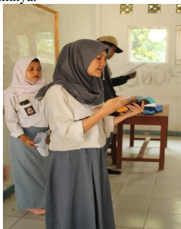
Gambar 4. Kegiatan Pelatihan Basic English for Computing/Reading

Gambar 3 menunjukkan bahwa siswa melakukan kegiatan berbicara atau belajar pengucapan dalam bahasa Inggris, melalui soal dan materi yang sudah dibahas sebelumnya.