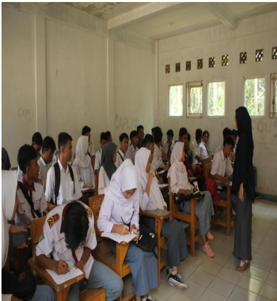
Gambar 1. Tim Memberikan Pengarahan Sebelum Pelatihan dilakukan

Berikut adalah hasil yang telah dicapai dalam pelatihan Basic English for Computing untuk siswa SMK Teksas Purwakarta. Pelatihan ini melibatkan seorang dosen dibantu dengan seorang mahasiswa, 30 orang siswa dan bermitra dengan satu sekolah. Kelas yang dipilih disesuaikan dengan kebutuhan khususnya yang membutuhkan pembelajaran bahasa Inggris khusus atau sesuai dengan kebutuhan dan kejuruan. Adapun kejuruan yang dipilih adalah Teknik Komputer dan Jaringan kelas XI.