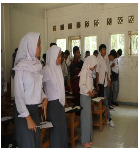
Gambar 3. Kegiatan Pelatihan Basic English for Computing/ Speaking

Di pertemuan ke enam sampai dengan ke tujuh, siswa dapat mengasah keterampilan membaca dan berbicara mereka lewat latihan-latihan yang membuat mereka membaca ulang soal-soal latihan lalu menjawab dengan bahasa Inggris yang disesuaikan dengan sejauh mana pemahaman siswa tentang pemrograman komputer dan kosakata bahasa Inggris mereka. Berikut contoh kegiatan saat siswa membaca dan berbicara saat mengisis soal tersebut: